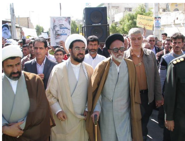
آیت الله حاج سید محمد حسین نسابه همراه با سایر اقبشار انقلابی مردم - لارستان - یوم الله ۲۲ بهمن ۱۳۸۹