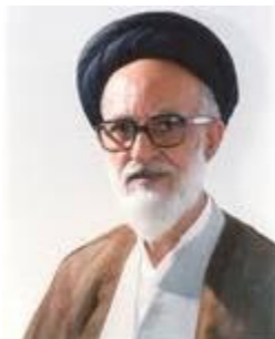
آیت الله حاج سید محمد حسین نسابه - لارستان

زندگینامه حضرت آیت الله حاج سید محمد حسین نسابه