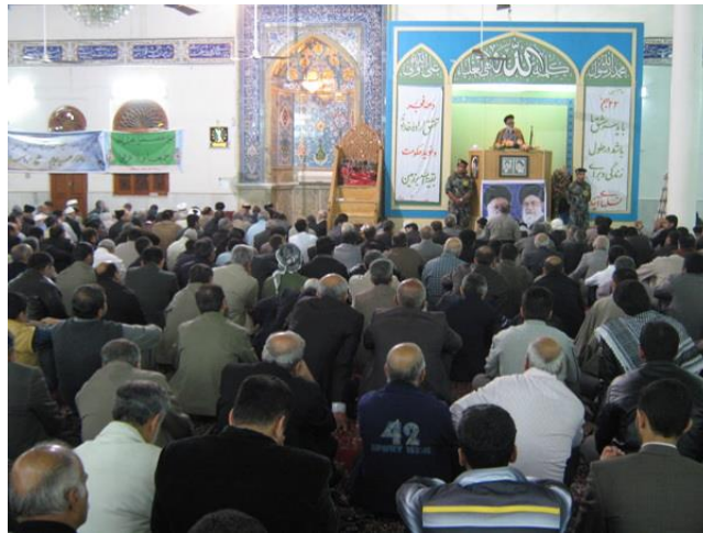
آیت الله حاج سید محمد حسین نسابه در حال ایراد خطبه های نماز جمعه - حسینیه اعظم لارستان

تدریس در حوزه های علمیه امام جعفر صادق (ع) و امام علی ابن ابیطالب (ع) لارستان نیز پرداخته و می پردازند.