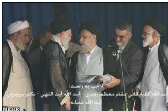
آیت الله نسابه در مراسم استقبال از رهبر معظم انقلاب اسلامی (مدظله العالی) - لارستان اردیبهشت ۱۳۸۷